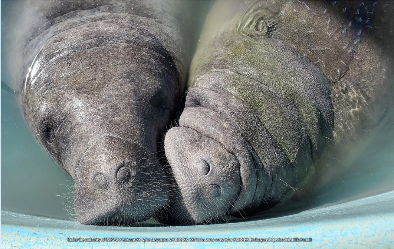
Trichechus manatus manatus , la subespecie antillana o caribeña del manatí de las Indias Occidentales.